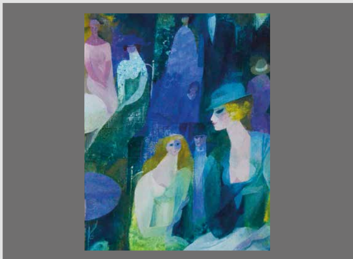
Parkszene, undatiert, Öl auf Leinwand, 25,1 x 19 cm, Privatbesitz.

Lieselotte von Faber, geborene Müller (1920 – 2014), verbrachte ihre Kindheit und Jugend in einer großbürgerlichen Familie in Nürnberg. Die künstlerisch begabte Neunzehnjährige besuchte für kurze Zeit die dortige Kunstgewerbeschule.