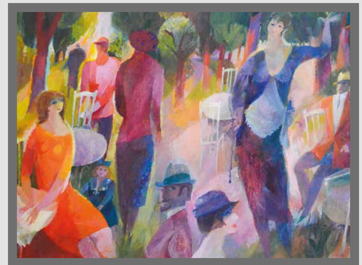
Parkcafé, um 1960, Öl und Gouache auf Malpappe, 40 x 50 cm, Privatbesitz.