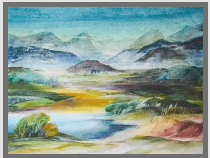
See in hügeliger Landschaft, 1987, Aquarell, 18,3 x 24 cm, Privatbesitz.