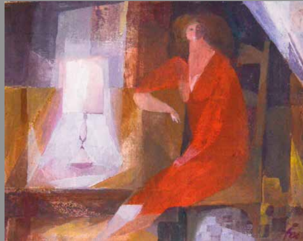
Frau am Tisch, undatiert, Öl auf Leinwand, 16,2 x 19,6 cm, Privatbesitz.